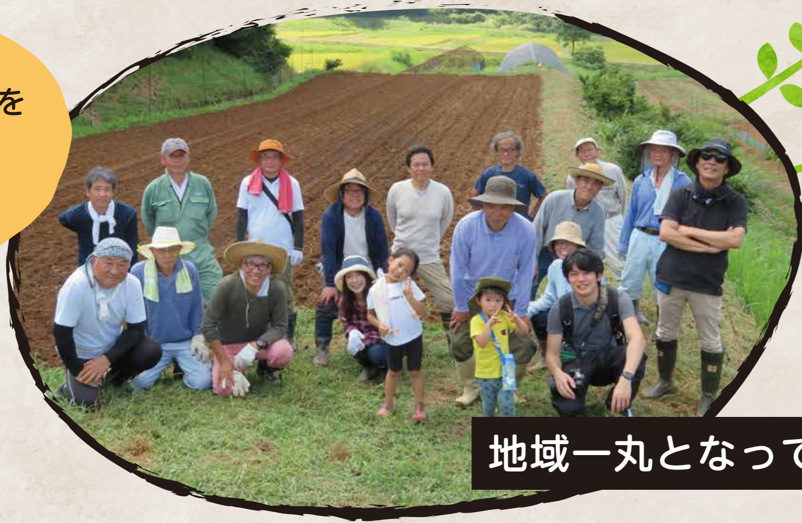
地域一丸となって