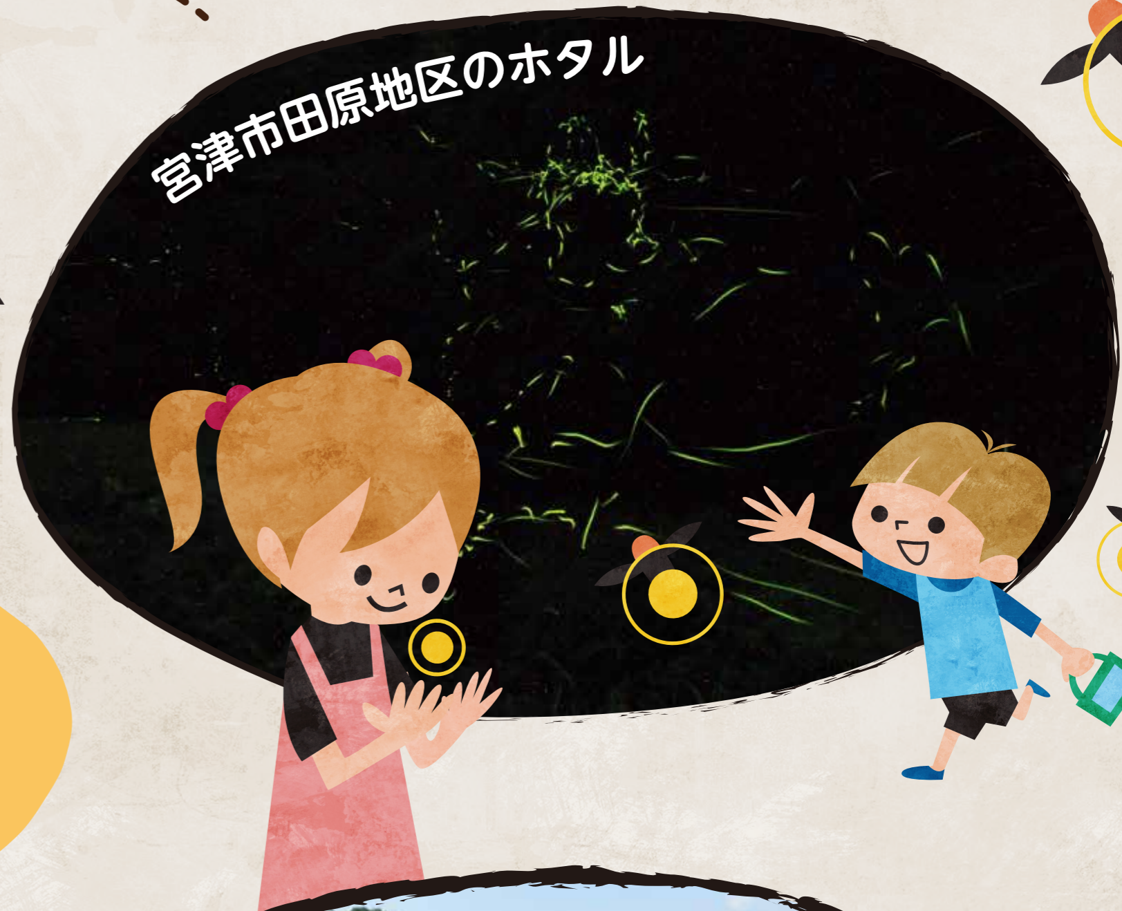
宮津市田原地区のホテル