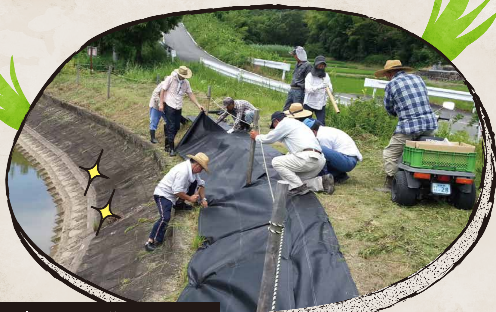
さまざまな組織とともに 一体的な地域づくり