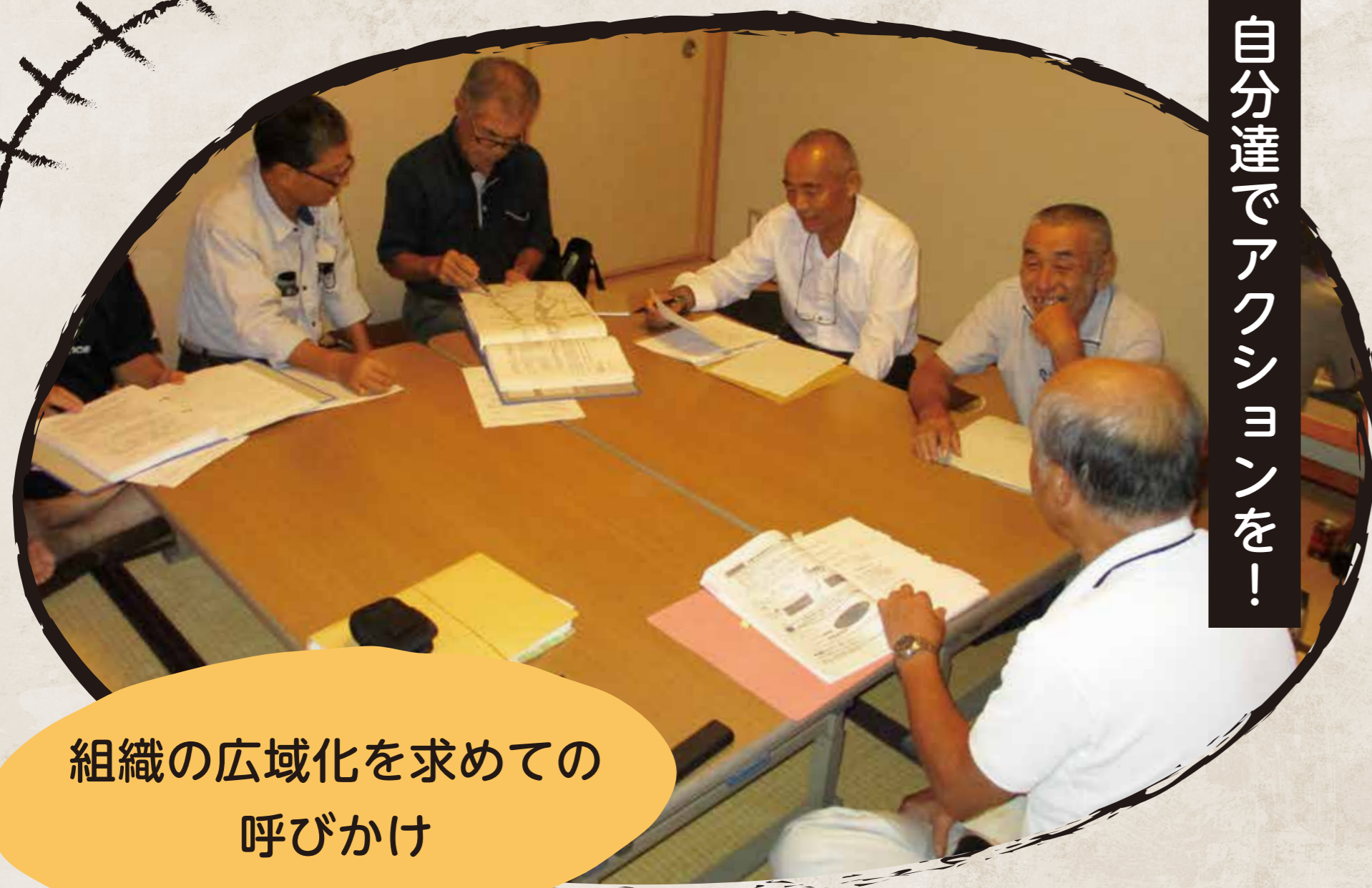
自分達でアクションを！