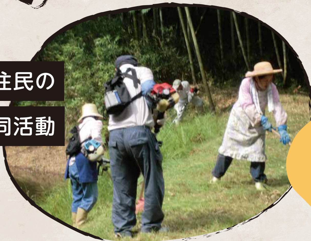
地域住民の 共同活動