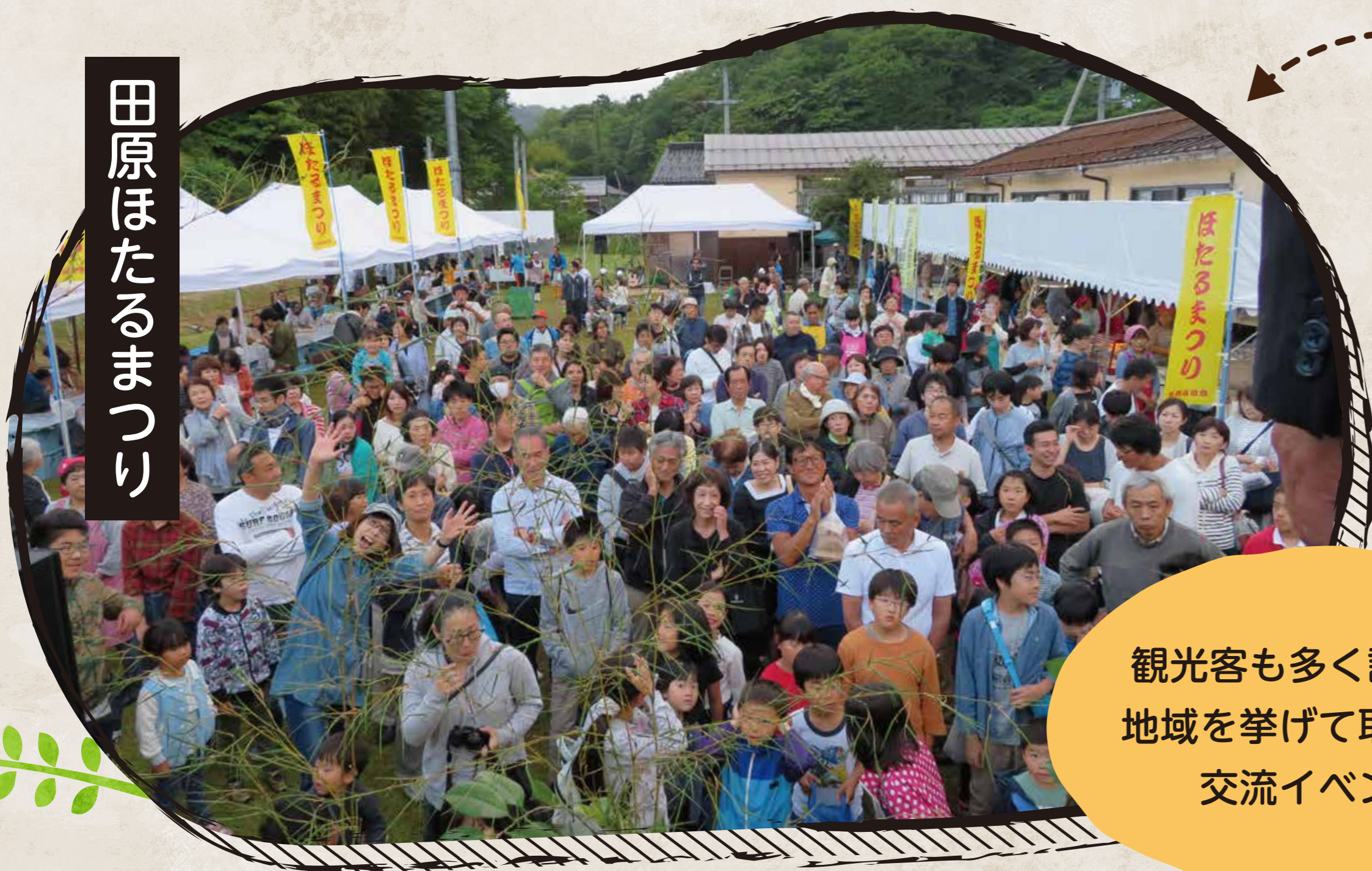
田原ほたるまつり