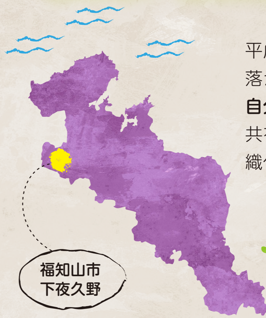
福知山市 下夜久野

平成の合併で福知山市の一部となった旧夜久野町内では、集落が消滅していることを目の当たりにして危機感を募らせ、自分達で自分達の地域を守らなければならないと思う意識を共有し、旧村単位である下夜久野を1つの単位とする広域組織化を図っています。