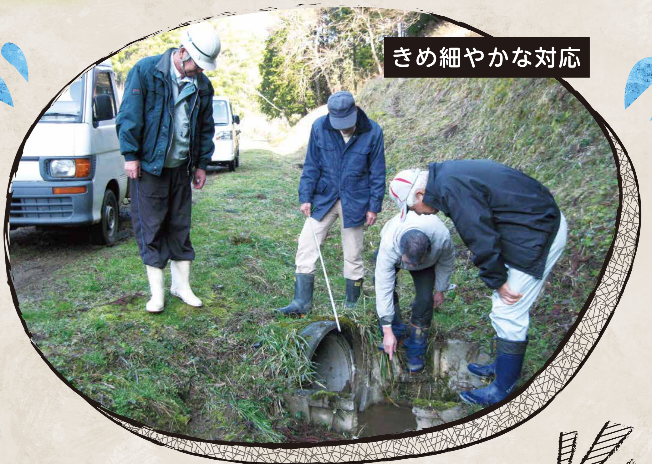
きめ細やかな対応