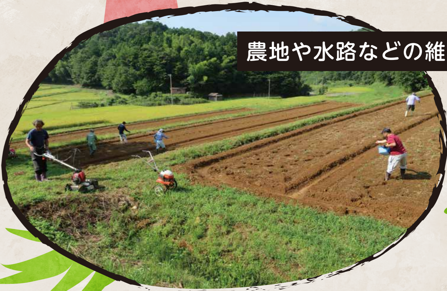
農地や水路などの維持管理