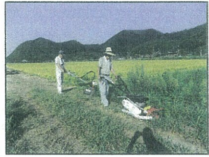
農道の草刈り 7月末と8月末の2回、(走行草刈機)