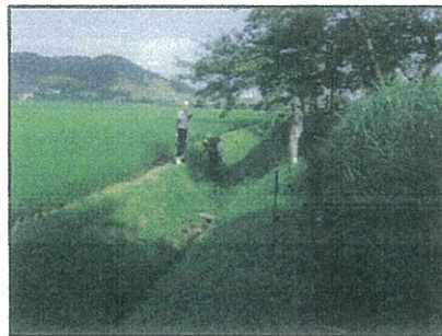
電気柵の敷設 7月16日