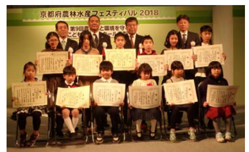
絵画コンクール表彰式