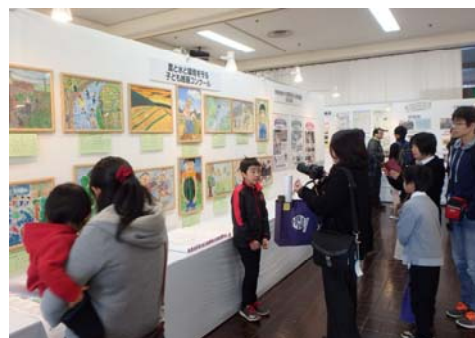
絵画コンクール作品展示