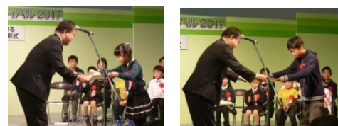
京都府知事賞受賞者 授与様子

※入賞作品は、京都府農地・水・環境保全向上対策協議会のホームページに掲載しています。