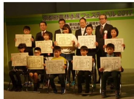
絵画コンクール受賞者