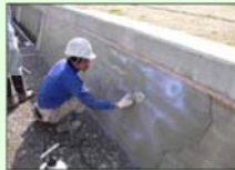
水路の補修・更新