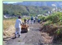
砂利舗装を 757アト舗装へ